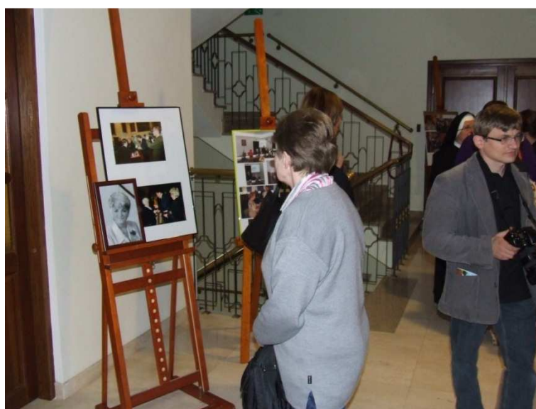
Ryc. 3. Wystawa poświęcona tragicznie zmarłej p. senator Janinie Fetlińskiej, Ciechanów - Opinogóra, maj 2010

WOZ PWSZ we współpracy z Zarządem Głównym PTP 13 maja 2010 roku zorganizowałX Kongres Pielęgniarek Polskich „ Na czele zmian: budując zdrowsze narody ”; wystawę poświęconą pamięci zmarłej tragicznie senator Janiny Fetlińskiej i zaprezentowaną na kongresie pielęgniarstwa przygotował oddział Głównej Biblioteki Lekarskiej.