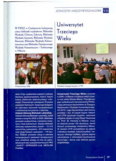
Ryc. 4. Strona z albumu jubileuszowego z okazji 10- lecia PWSZ w Ciechanowie, 10 lat Państwowej Wyższej Szkoły Zawodowej w Ciechanowie i Mławie , Ciechanów 2011, s. 77.

Oddział terenowy GBL na stałe wpisał się już w tradycję uczelni. Informacje o oddziale umieszczane są w każdym informatorze PWSZ 20 , zaś opatrzone fotografiami tekst ukazał się również w dwóch uczelnianych albumach jubileuszowych 21 .