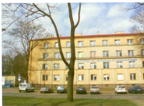
Fot. 3. Szpital im. Tytusa Chalubińskiego

Rok 1939, zamykający okres II Rzeczypospolitej, otwierał zarazem dla mieszkańców Częstochowy niemal pięcioletni okres wojny i okupacji niemieckiej. Otwierał on jednocześnie niezwykle trudny etap w funkcjonowaniu miejskiej służby zdrowia, która musiała podporządkować się zarządzeniom administracji okupanta i, siłą rzeczy, została w znacznym stopniu ograniczona do minimum. Jedną z najnowocześniejszych w mieście placówek leczniczych -Szpital Izraelicki- praktycznie zlikwidowano. Jego budynek zaanektowała niemiecka policja. Personel początkowo rozproszono po innych placówkach, a wkrótce poddano antysemickim represjom. W najstarszym miejskim szpitalu miasta- pod wezwaniem Najświętszej Maryi Panny- utworzono Szpital Jeniecki. W 1940 r., w związku z wybuchem epidemii duru plamistego, powołano do życia Szpital Dermatologiczny, przy którym zorganizowano kwarantannę i uruchomiono zakład dezynfekcyjno-kąpielowy, tzw. "odwyszalnię" o przepustowości 20 osób jednorazowo. Źródłem epidemii były organizowane przez Niemców obozy dla jeńców sowieckich. Opanowanie i wygaszenie chorób zakaźnych stanowiło dla ówczesnych służb medycznych miasta niezwykle trudny problem, głównie ze względu na brak szczepionek, zarezerwowanych dla niemieckiej armii oraz z powodu tragicznych warunków sanitarnych panujących w obozach. Walkę z epidemiami, które dziesiątkowały więźniów, przypłaciło życiem także kilkoro spośród pracowników personelu medycznego tychże obozów.