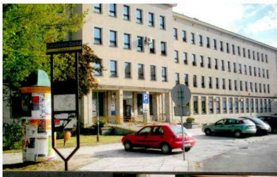
Fot.5. Szpital „Tysiąclecie”

Z racji usytuowania w dzielnicy „Tysiąclecie” nosi także potoczną nazwę, choć oficjalnie w roku 1970 nadano jej imię prof. Witolda Orłowskiego. Podobnie jak inne instytucje miasta, zmieniała przez kolejne lata swojego istnienia przynależność do różnych jednostek administracyjnych. Aktualnie stanowi część Wojewódzkiego Szpitala Specjalistycznego.