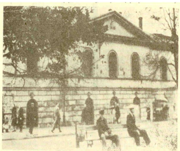
Ryc. 21. Nieistniejący już Szpital Panny Marii w Częstochowie, jedno z miejsc

Generalną zmianę w zakresie opieki zdrowotnej nad mieszkańcami Częstochowy przyniosło utworzenie w I połowie XIX w. pierwszego szpitala miejskiego, którego akt założycielski podpisała Rada Miasta w 1834 roku. Środki finansowe na jego budowę wyasygnowały władze miasta. Znaczna ich część pochodziła ze zbiorów publicznych i składek mieszkańców. Projekt architektoniczny szpitala stał się udziałem znanego i cenionego w tym okresie warszawskiego projektanta budowli publicznych Henryka Marconiego. Budowa trwała 3 lata, a nad całością inwestycji pieczę sprawowała Rada Szczegółowa. Oddany do użytku w czerwcu 1838 roku obiekt liczył 7-9 łóżek, których ilość stopniowo zwiększano (aż do 65 w 1902 roku).