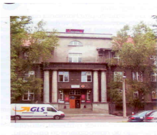
Fot. 4. Szpital im. Władysława Biegańskiego

W roku 1951 istniejącemu, przedwojnemu szpitalowi Kasy Chorych, który w 1946r. wszedł w skład Powszechnego Szpitala Miejskiego, nadano imię dr. Władysława Biegańskiego, pod którym funkcjonuje do dnia dzisiejszego.