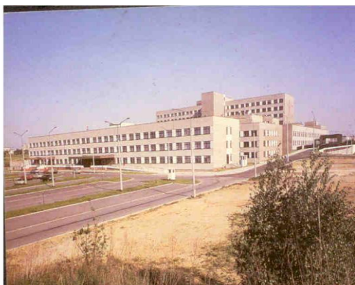
Fot. 6. Szpital „Parkitka”

Rok 1988 zapisał się w historii Częstochowy jako data oddania dla potrzeb mieszkańców i okolicznych miejscowości najnowszego i zarazem największego szpitala – Wojewódzkiego Szpitala Specjalistycznego. Warto przypomnieć, iż jego wstępny projekt powstał jeszcze w okresie II Rzeczypospolitej, ale nie uległ skonkretyzowaniu z powodów finansowych.