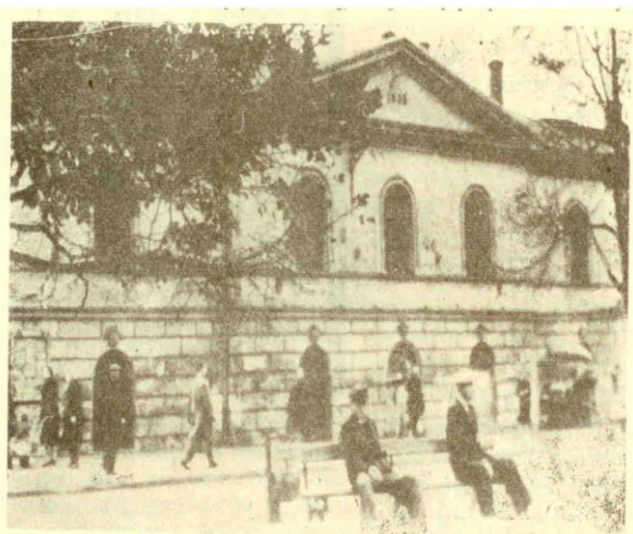
Ryc. 21. Nieistniejący już Szpital Panny Marii w Częstochowie, jedno z miejsc

Generalną zmianę w zakresie opieki zdrowotnej nad mieszkańcami Częstochowy przyniosło utworzenie w I połowie XIX w. pierwszego szpitala miejskiego, którego akt założycielski podpisała Rada Miasta w 1834 roku. Środki finansowe na jego budowę wyasygnowały władze miasta. Znaczna ich część pochodziła ze zbiorów publicznych i składek mieszkańców. Projekt architektoniczny szpitala stał się udziałem znanego i cenionego w tym okresie warszawskiego projektanta budowli publicznych Henryka Marconiego. Budowa trwała 3 lata, a nad całością inwestycji pieczę sprawowała Rada Szczegółowa. Oddany do użytku w czerwcu 1838 roku obiekt liczył 7-9 łóżek, których ilość stopniowo zwiększano (aż do 65 w 1902 roku).